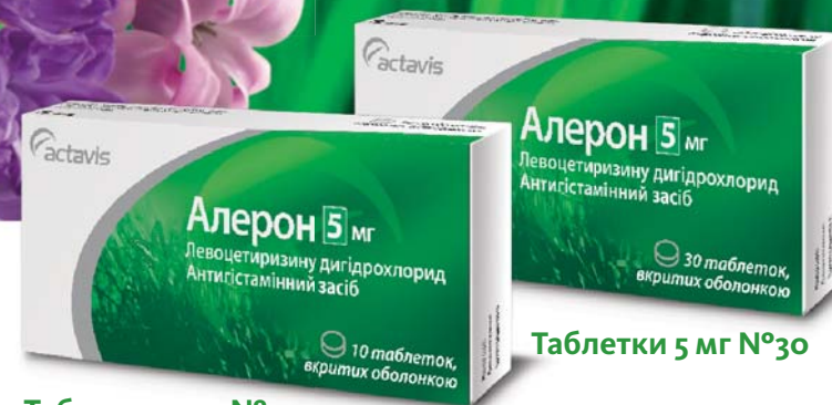
Таблетки 5 мг №10

Неседативний антигістамінний засіб, потужний селективний антагоніст периферичних H 1 -рецепторів